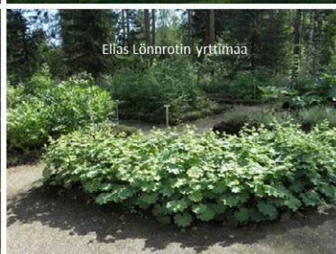
Elias Lönnrotin yrttimäätä