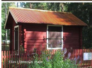
Elias Lönnrotin majaa