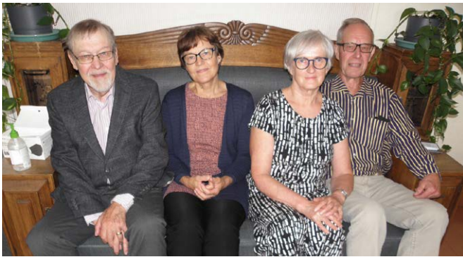
Lyytikäisiä Kajaanin Raatihuoneella...

SUKUSEURAN 20-V JUHLATAPAAMINEN siirtyi koronapandemian vuoksi tulevaisuuteen toisen kerran. Tilanne näytti lupaavalta kesäkuun alussa hallituksen kokouksen aikaan, joten suunnittelimme kaksipäiväisen juhlatapaamisen ja varasimme paikat kokoontumista ja juhlaillallista varten. Heinäkuun lopussa koronatilanne Kajaanissa heikkeni, jolloin osallistujia ymmärrettävästi ei ilmoittautunut lainkaan. Jouduimme perumaan juhlatapaamisen varauksineen elokuun alussa.