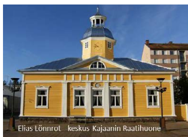
Elias Lönnrot -keskus Kajaanin Raatihuone

Lähtökohtia Elias Lönnrot -seuran työlle antaa mm. Kainuun Opisto Oy:n vuonna 1998 laatima selvitys ” Kulttuurimatkoja Kalevalan lähteillä - Kainuun Lönnrot-reitit ”. Selvitys päivitetään kulttuurimatkoiksi nykytiedon ja olojen pohjalta. Elias Lönnrot -seuran työryhmä on toteuttanut 2012-2013 Kainuun kulttuuri-