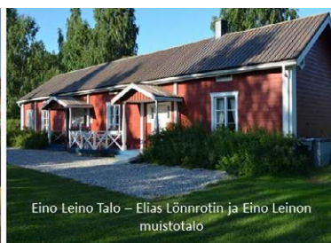
Eino Leino Talo - Elias Lönnrotin ja Eino Leinon muistotalo