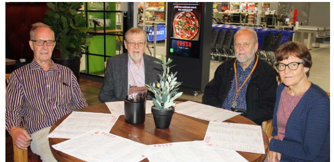
...ja Rossossa 15.8.2021